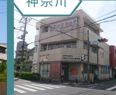
川崎セツルメント診療所