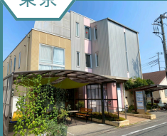
北足立生協診療所