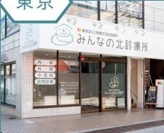
みんなの北診療所